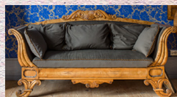
Fasong, tekstiler, stopp og puter er vesentlige på en gammel sofa. Biedermeier 1830.

INNSIKT i interiør-, tekstil-, tapet-, gjenstands- og møbelhistorie, stilhistorie, håndverksteknikker og håndverkshistorie, fag- og historisk temalitteratur samt praktisk erfaring og teorianvendelse. Hvordan rekonstruere tapte deler? Overflatebehandling? Skadereparasjon? Tilbakeføring eller nennsom konservering? Svarene vil være forskjellige i hvert enkelt tilfelle. Vi tilbyr breddekunnskap kombinert med dybdekunnskap på viktige spesialfelt.