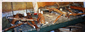
Tre rokokkostoler (1760) i bæ-repose, ble tre stoler på egne (og rekonstruerte) ben.

Møbler i stilspennet barokk til biedermeier. Vi har spesialisert oss på finreparasjoner, historiske overflatebehandlinger, forgylling og rekonstruksjon av tapte deler. Vi har arbeidet mye med historiske stoppeteknikker og historiske tekstiler.