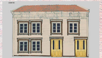
Skippergaten 43, Kristiansand. Rekonstruksjon av hovedfasade. Panelfargeavdekking, Kalfarvn. 122, Bergen. Borgerhus ca. 1840.

Ikke bare fredede hus er skattkister. Mer av fortidens dekor er bevart enn huseiere flest er klar over. Avdekking kartlegger og muliggjør kvalifiserte og inspirerte beslutninger. Huset ditt er kanskje mer inspirerende enn du aner?