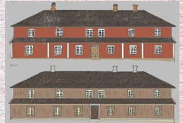
Eidsfos Hovedgård, Hof. 1770/1835

BYGNINGSUNDERSØKELSEN og arkivmateriale er utgangspunkt for å forstå bygningshistorien. Profesjonelt utstyr muliggjør effektivt og grundig feltarbeid. Redigering og behandling i Adobe CC. Synliggjøres i sluttrapport.