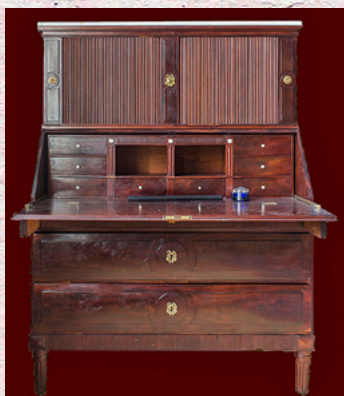
Restaurert skatoll. Tegnet av C. F. Harsdorff 1770-80

BYGNINGSHISTORIE * DOKUMENTASJON * PLANLEGGING * RESTAURERING * MØBLER