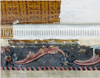
Louis-seizebord 1808 og sjablonmalt list 1900. Mesterhuset Reperbanen i Sandviken, Bergen. Fredet

VELLYKKET RESTAURERING OG UTVIKLING av gamle hus forutsetter at man vet hva man har og forstår hva man ser. Er huset fredet, må utgangspunkt for planer dokumenteres. Vi gir kunnskap om bygningshistorien - beslutningsgrunnlaget før igangsetting. Vi har erfaring fra store og små prosjekter, offentlige og private oppdragsgivere, bygninger av nasjonal og lokal verneverdi. Erfaring gjennom 34 år. Våre tjenester bidrar til å ferdigstille prosjekter.